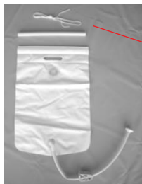
2. Kit sacca acqua