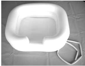
1. Shampoo basin