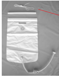
2. Water pouch kit