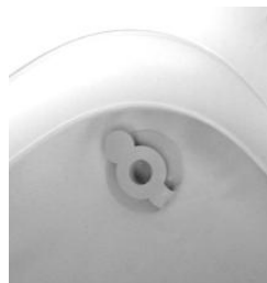
Tappo di scarico