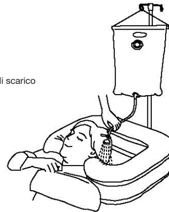
Illustrazione di applicazione