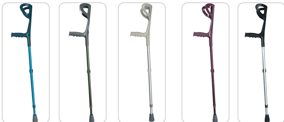
• Blu RP701B

Si raccomanda di evitare contatti prolungati con acqua e di controllare periodicamente la robustezza della stampella. Per evitare eventuali rischi tenere la stampella avambraccio lontano dalla portata dei bambini e sostituire i puntali di appoggio a terra una volta usurati.