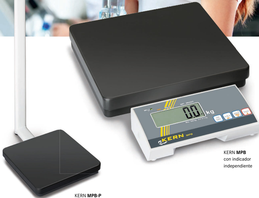
KERN MPB con indicador independiente