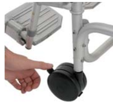
• Pict. 5

The lever on the brake must tighten the wheel. In case of necessity check the pressure of the casters. If necessary adjust the loosen nut and then tighten up the nut.