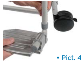
• Pict. 4

The footrest of shower chair can be adjusted according to various requirements. You have to push the locking clip on the footrest (Picture 4) not less than 6.5cm distant from the floor. Check that both footrest are adjusted at the same height.