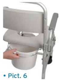
• Pict. 6

Use the toilet when the wheelchair is still. To use the toilet take out the removable part of the seat using the handle on the front part. Take out the toilet using the handle (Picture 6).